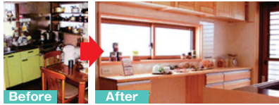
天然無垢材オリジナルキッチン仕様

家族がいる居間と隔離されたキッチン。動線が悪いだけでなく、収納が無くてダイニングテーブルが物置状態。この使いづらさを何とかして!!