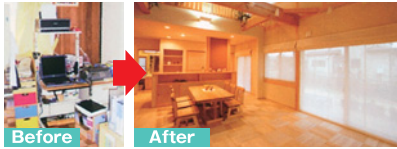
家族の雰囲気が伝わる開放的なリビング。

家具や家電品、タンスなどモノがあふれて、もともと狭かった部屋がさらに狭く、家族が集まれない。これでは友達も呼べない。